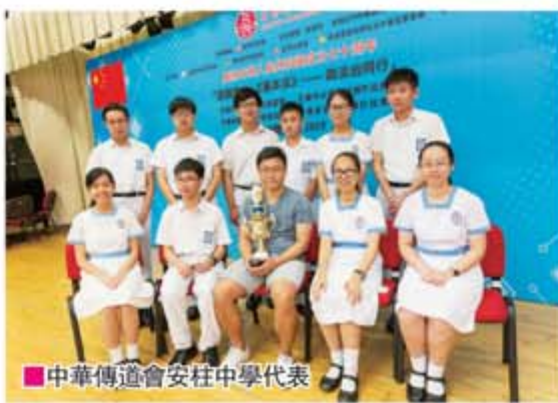
中華傳道會安柱中學代表